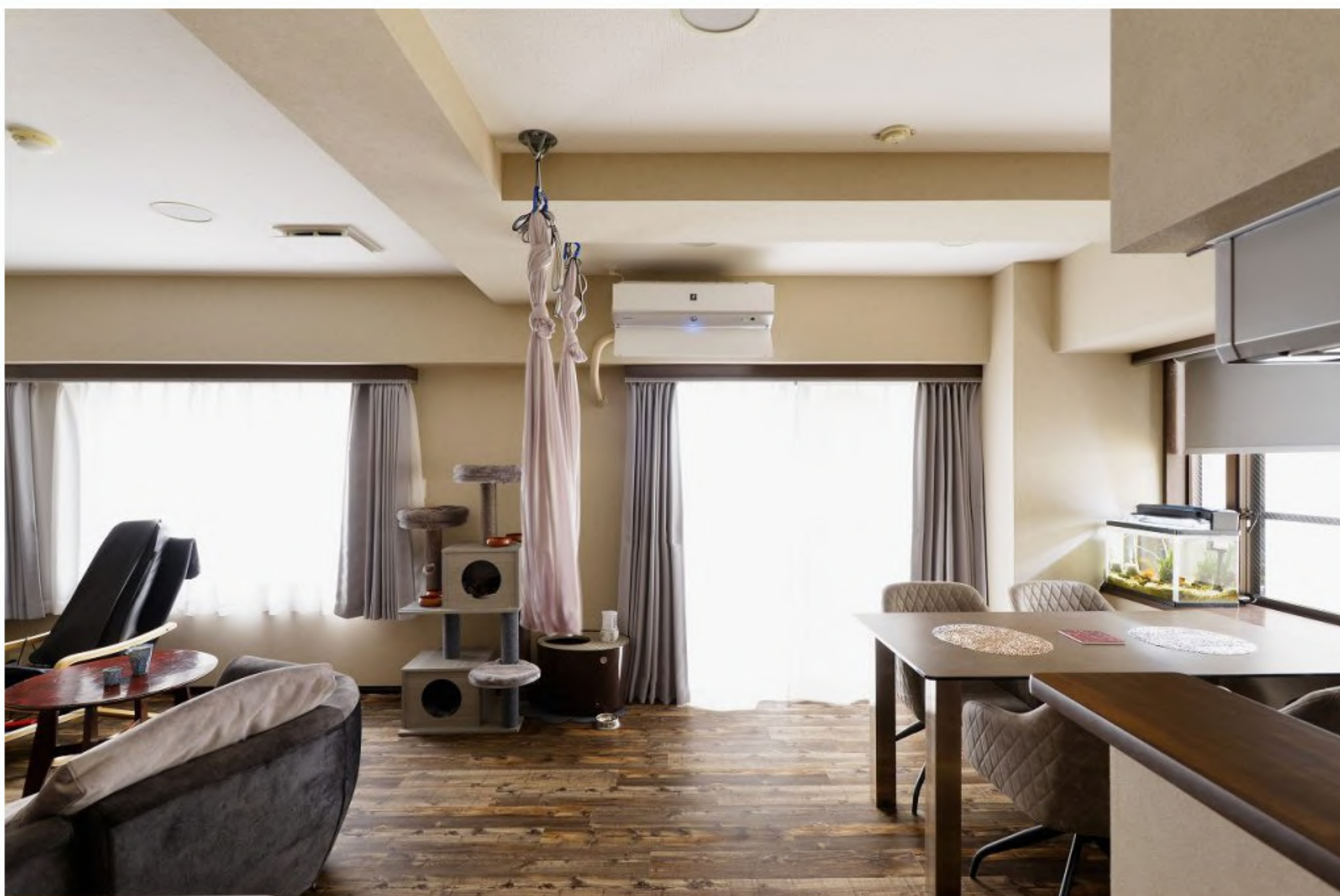
ワンちゃんネコちゃんと暮らしているため、床は滑りにくく、お掃除のしやすいフロアタイルをご提案しました