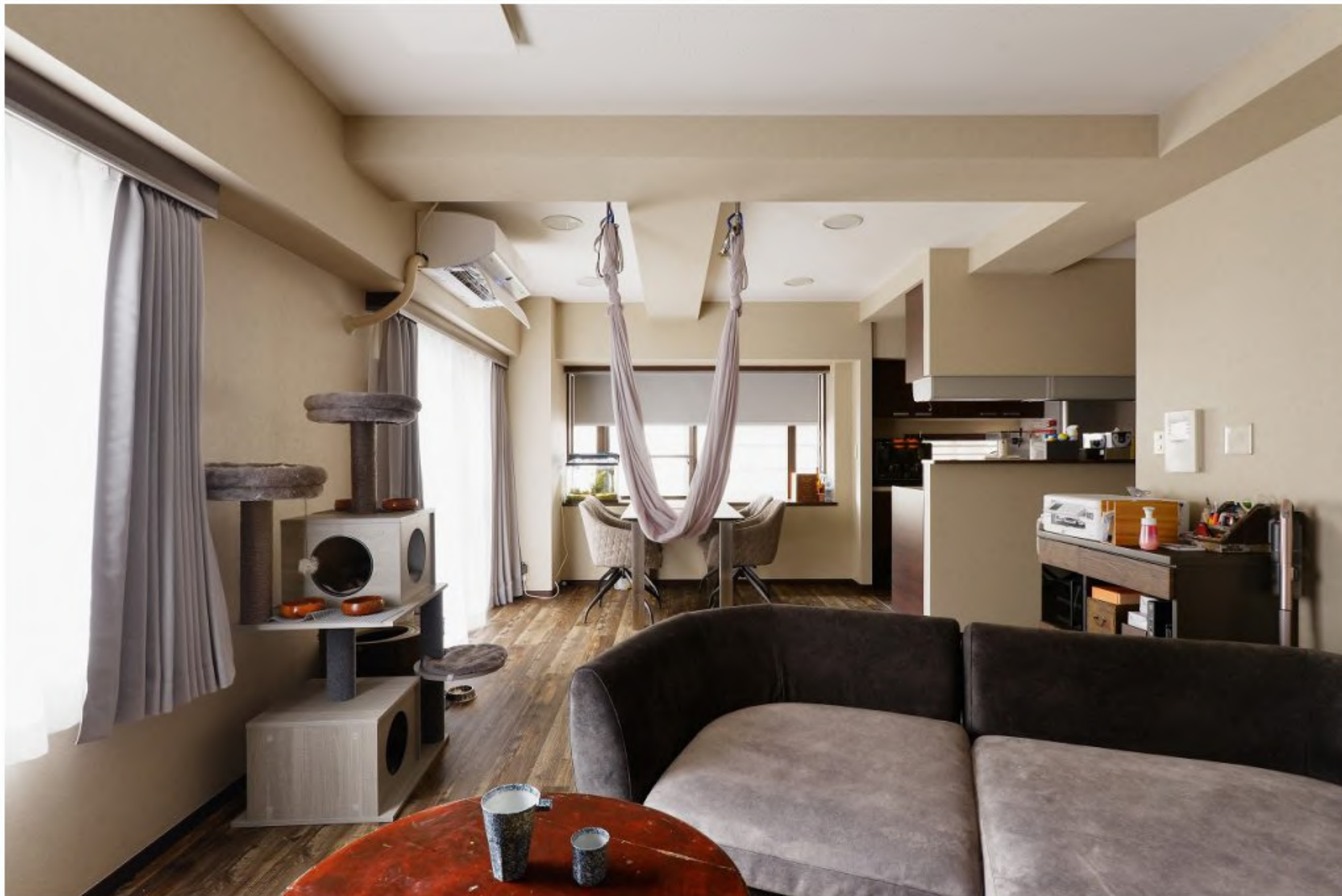
ハンモックヨガ教室の先生である奥様のご要望で、リビングにハンモックを施工しました