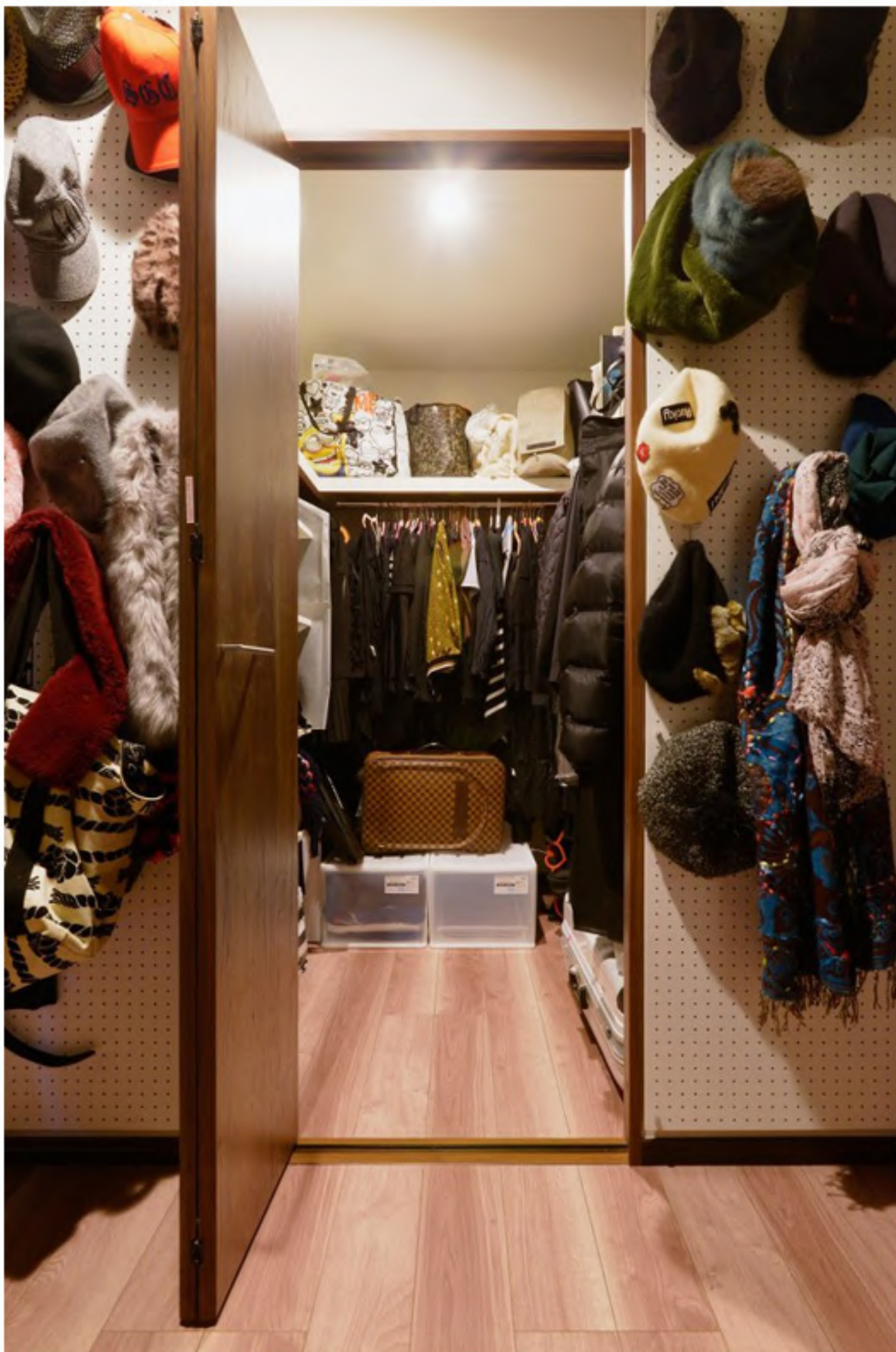
ウォークインクローゼット入り口の壁に有孔ボードを施工することで、見せる収納スペースへ