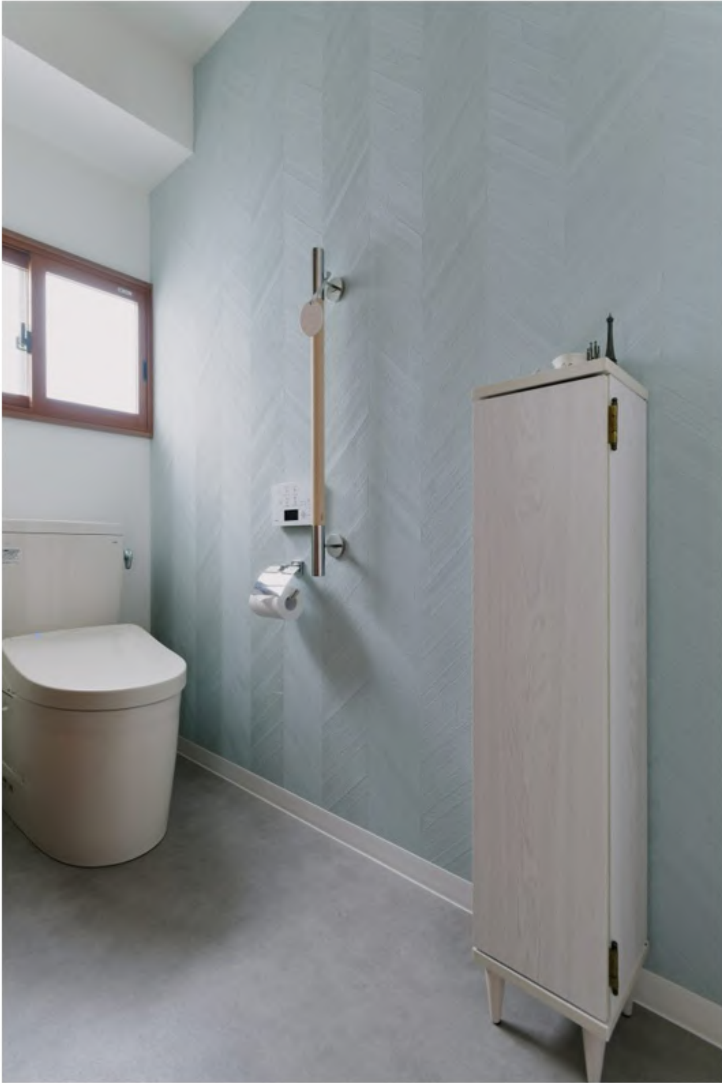
トイレ：淡いブルーの壁紙にインナーサッシの付けた心地よいトイレ