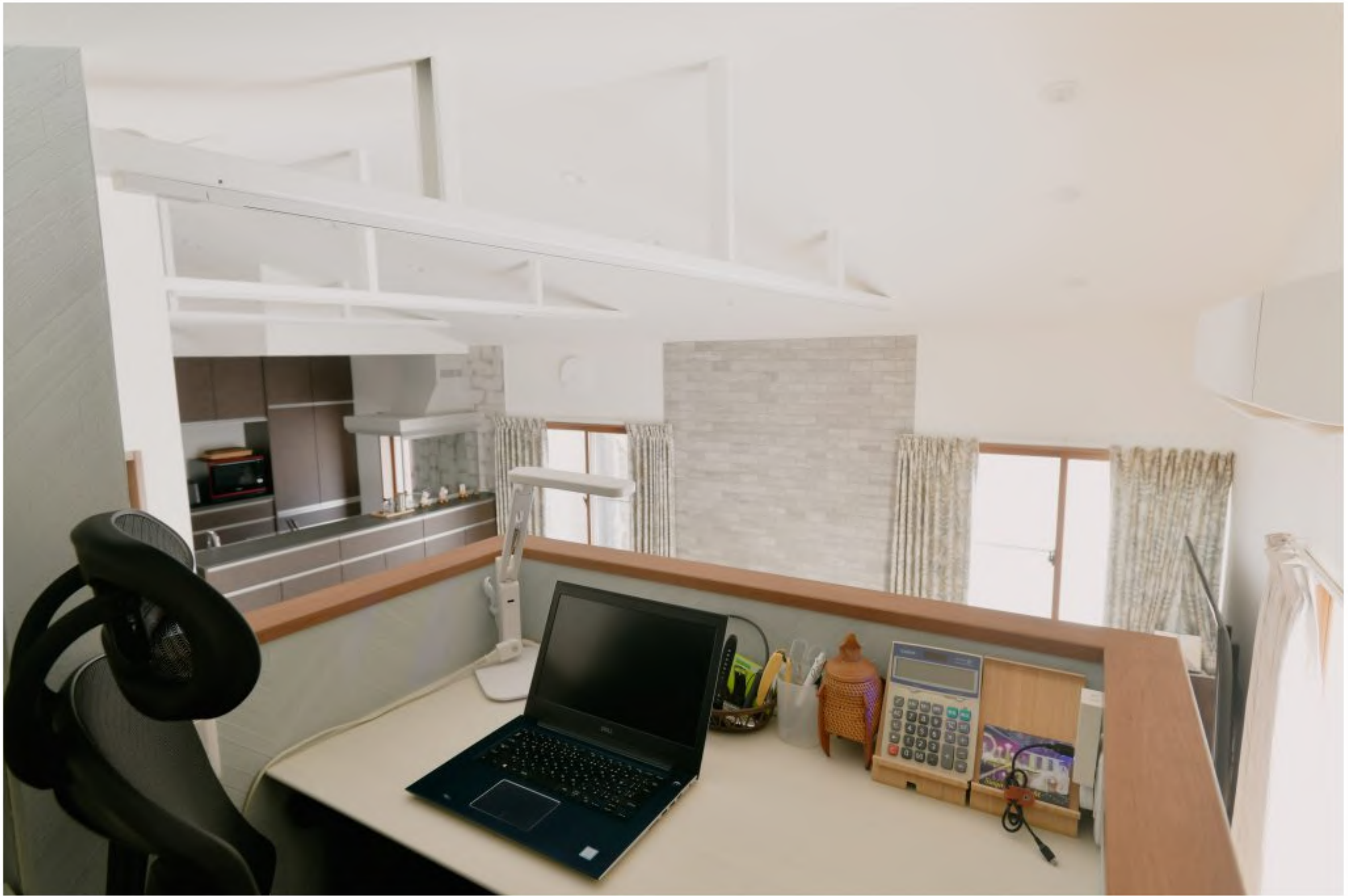
ワークスペース：リビングが見渡せるので家族を見ながら使える場所になりました。