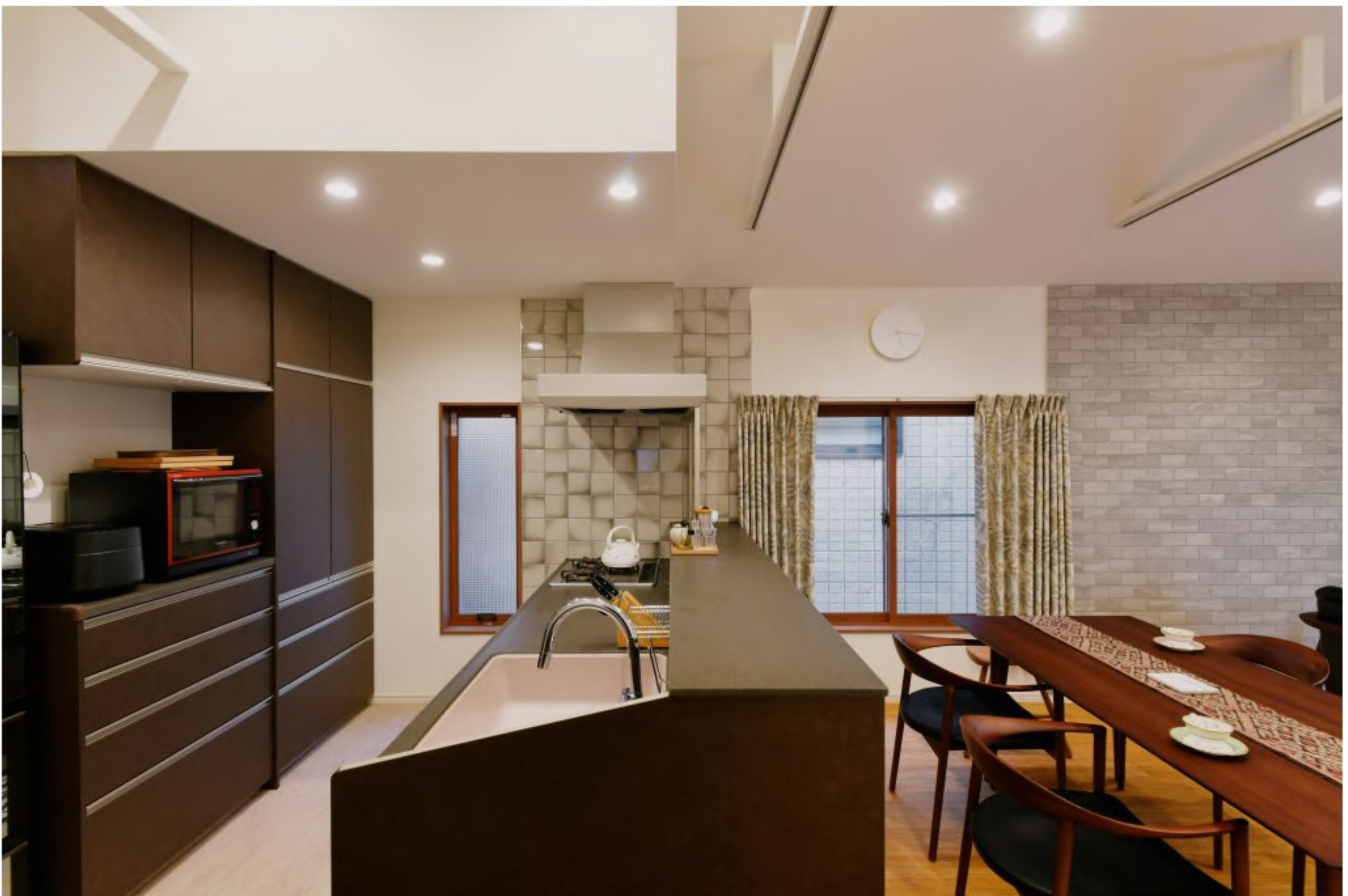
キッチン：嬉しい対面式キッチン

キッチン：対面キッチンはトクラスのベリーにミーレの食洗機を採用しました。収納量、使い勝手全体が向上し、家族を見ながら料理ができるようになりました。