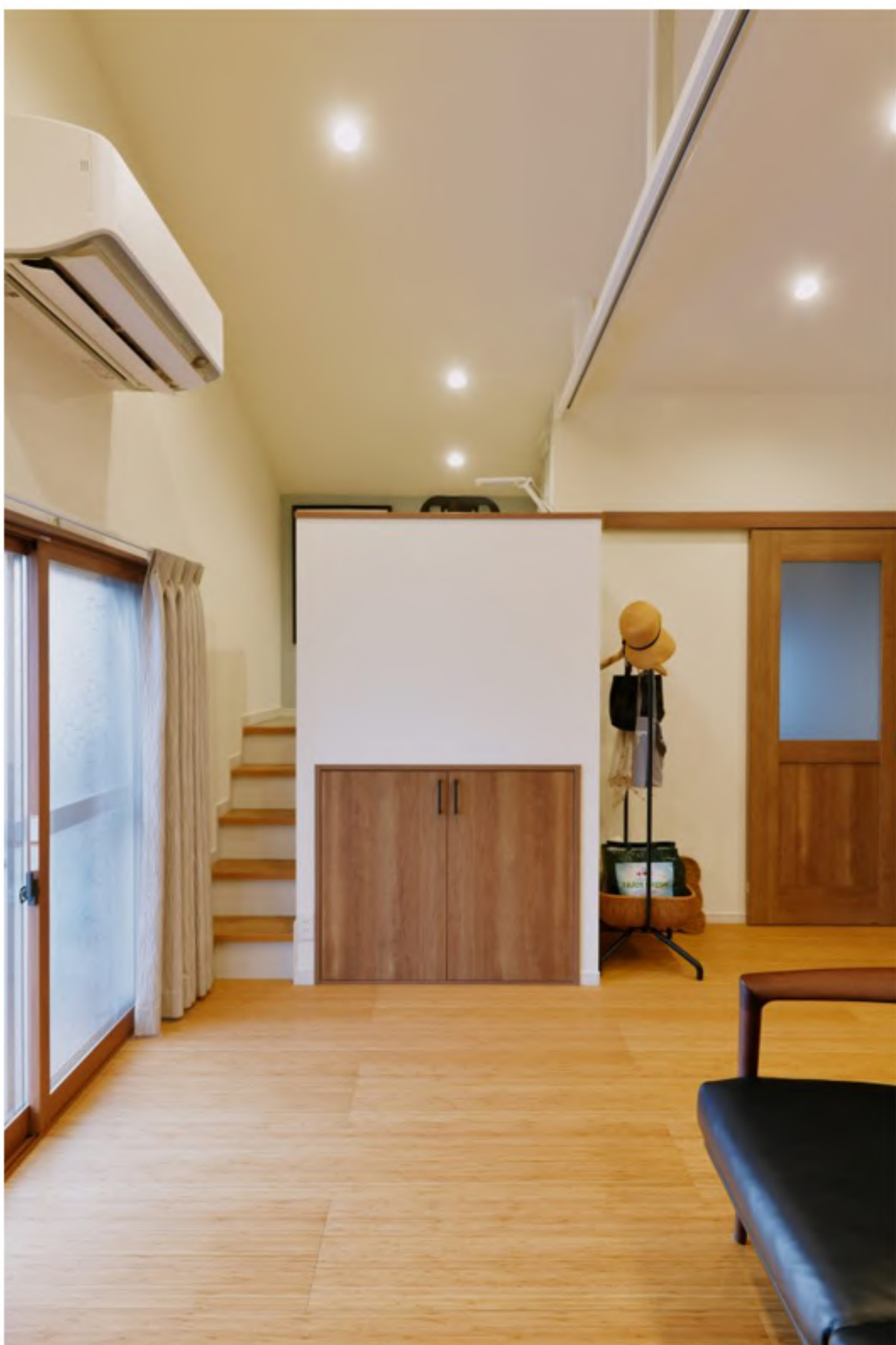
ワークスペース：LDKにスキップフロアでワークスペースを作りました。下部はリビングから使える収納、秘密基地のようなワクワクと集中して仕事ができるようになりました。