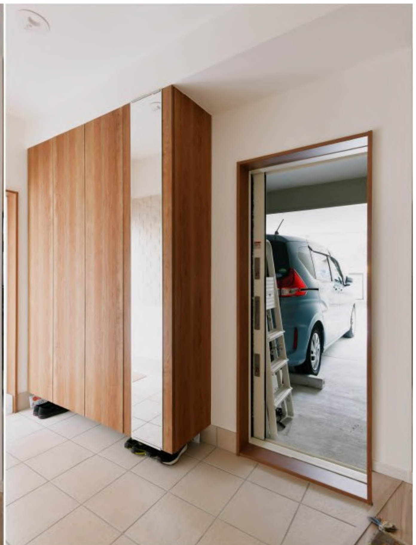
1F玄関：大収納のフロート収納とガレージに続く扉