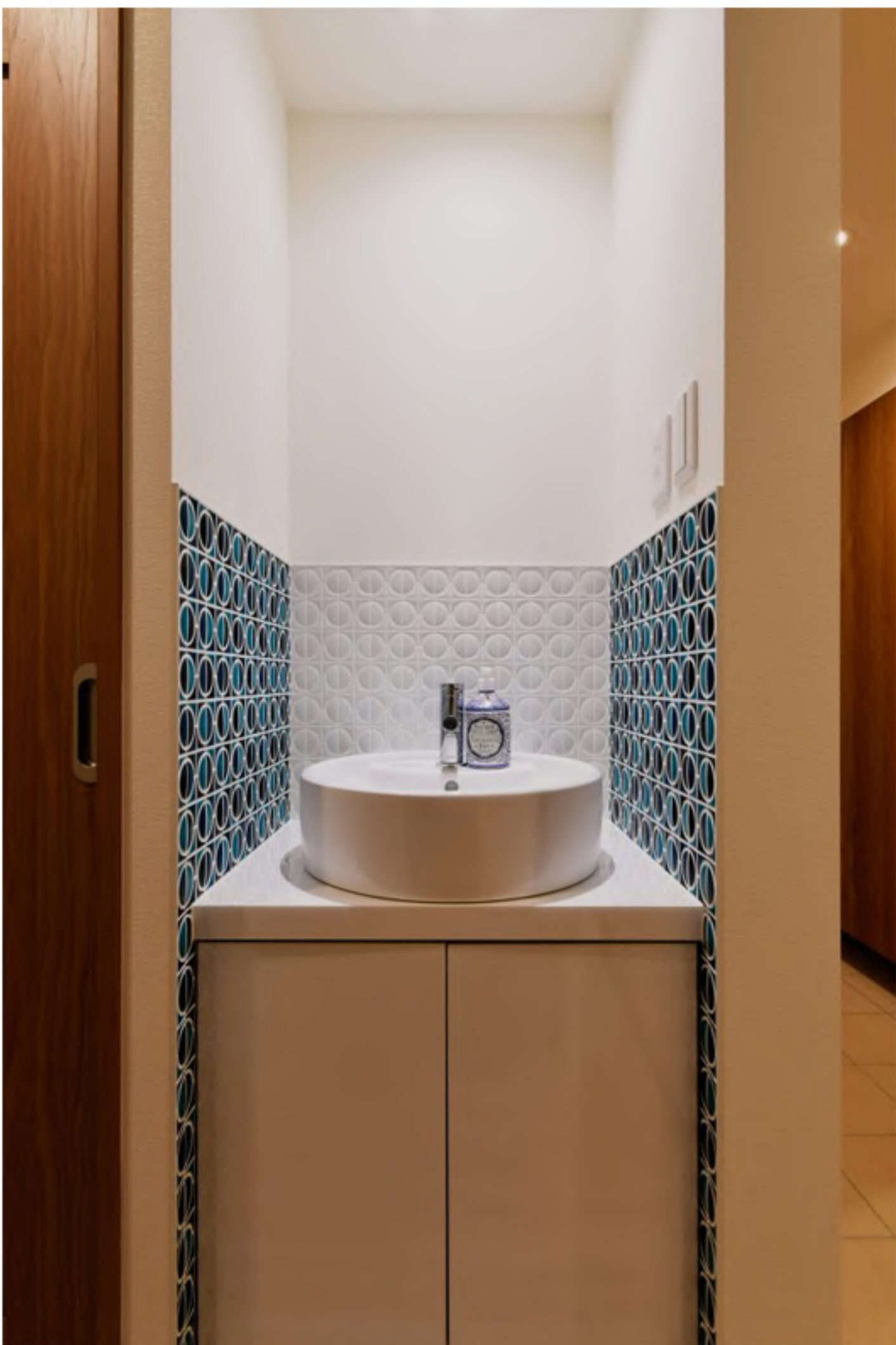
1F洗面：印象的なタイルがきれいです