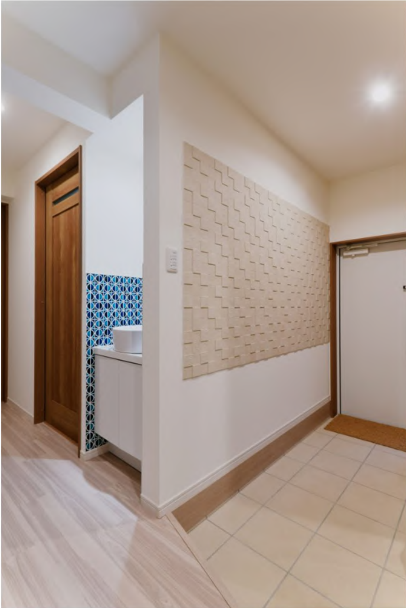
1F玄関ホール：タイルがいいアクセントに